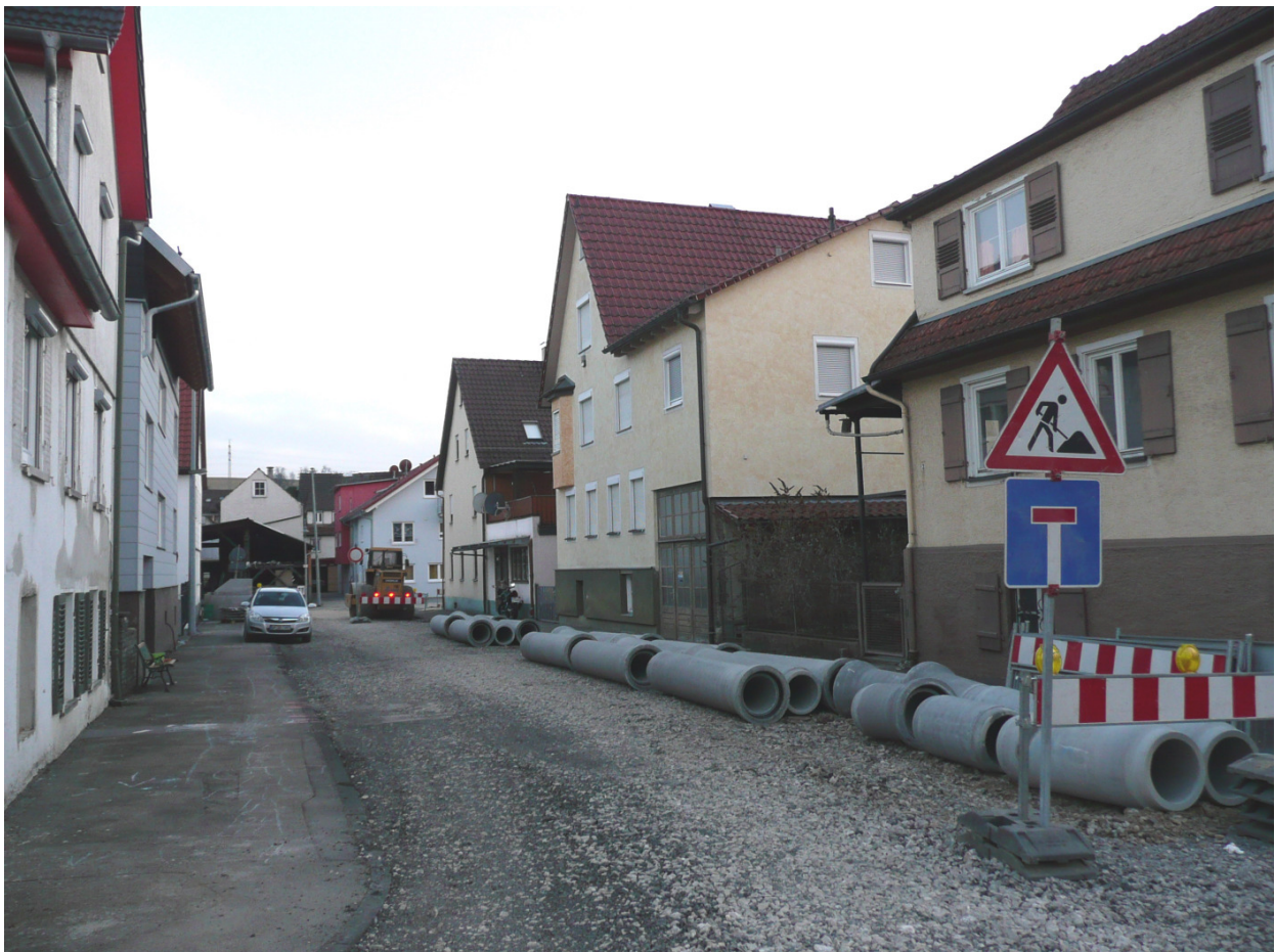
Abbildung: Bereits begonnene Erneuerung der Oberdorfstraße.

Ausführlichere Informationen zu dieser Thematik finden sich in den beiden Protokollen zu den o.g. Veranstaltungen, vgl. unter: http://www.uhingen.de/aktuelles/sanierungsgebiet_oberdorf/index.html .